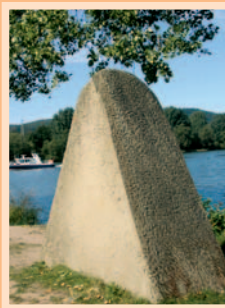
2.) „Stein an der Mündung“