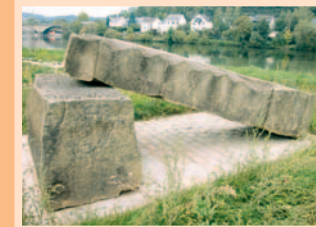
4.) „Au bord de l'eau“