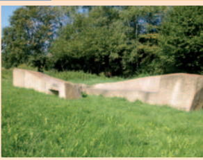
15.) „Zwei Wellen“