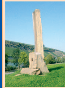
14.) „Prière de toucher“