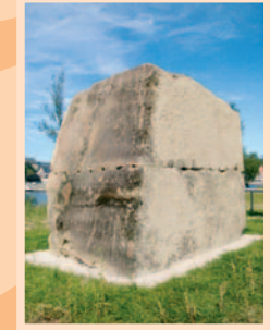
6.) „Zusammengefügter Steinblock mit Hohlform“