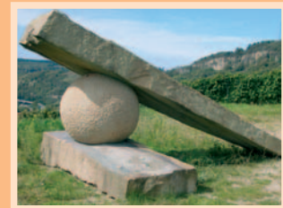
8.) „Knie mit Gelenk“