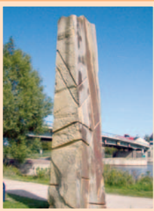
1.) „Archaische Spuren“