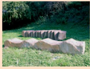
12.) „Impressioni distratte“