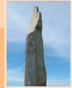
7.) „Großer Zeiger“